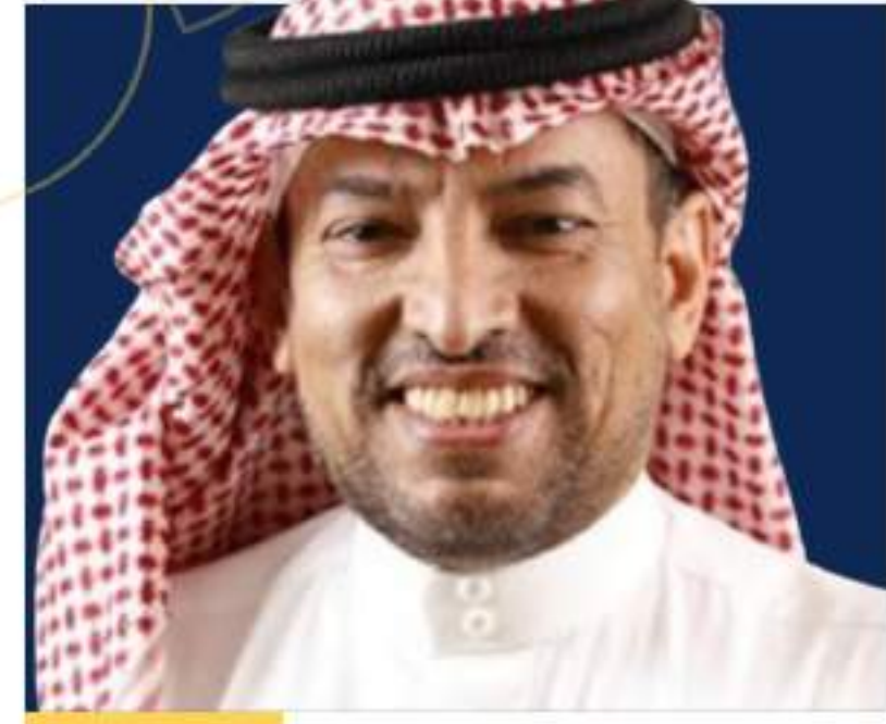
الاستاذ الدكتور سليمان بن محمد الناصر

الحمد لله الذي وفقنا لخدمة وطننا ومجتمعنا، والصلاة والسلام على أشرف الأنبياء والمرسلين، سيدنا محمد وعلى آله وصحبه أجمعين.