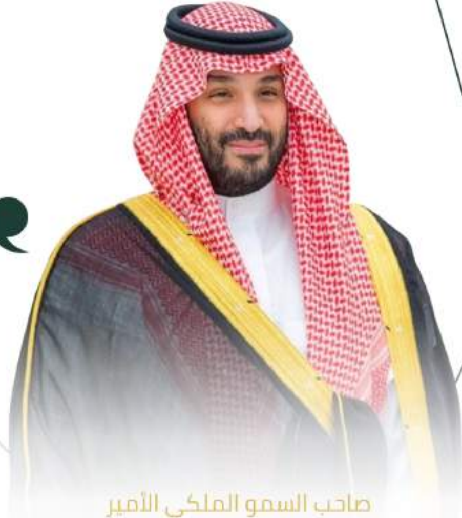
صاحب السمو الملكي الأمير

محمد بن سلمان بن عبدالعزيز آل سعود ٢٠١٥ م - ٢٠١٦ م