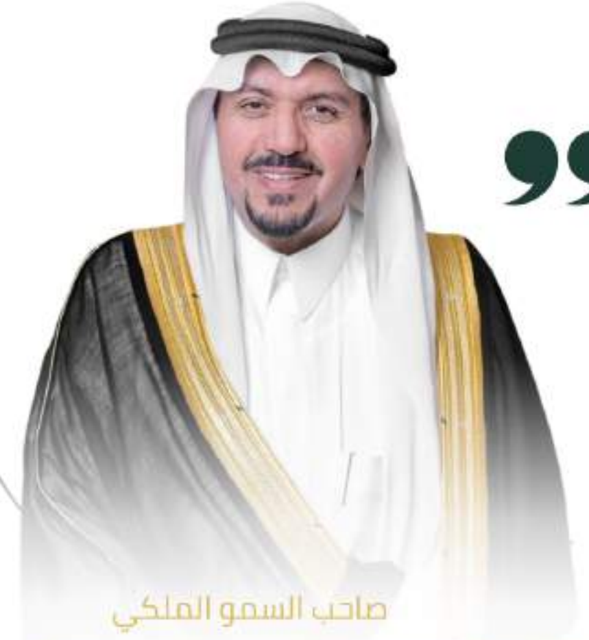
صاحب السمو الملكي

اللهم صل على سيدنا محمد وعلى آله وصحبه وسلم اللهم صل على الأمير سلطان بن عبدالعزيز آل سعود